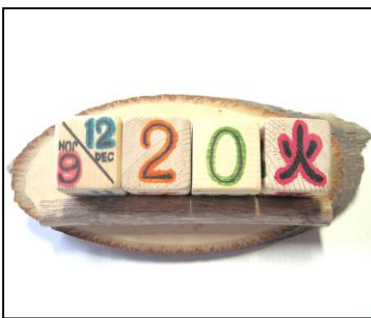
キューブカレンダー（270円）