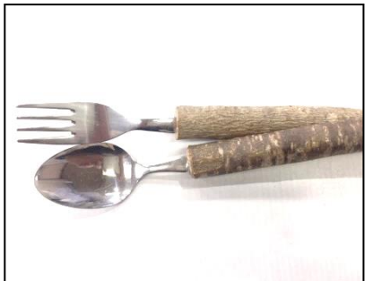
ミスフーン・フォーク（各150円）

※その他、ご要望に応じて可能なものは対応いたします。電話にて研修担当にご相談ください。