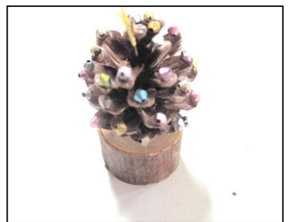
まつぼっくりツリー（90円）