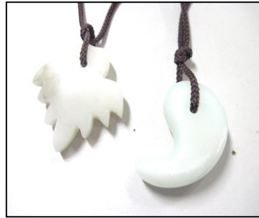
ストーンペンダント（200円）