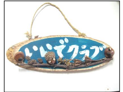
壁掛けプレート（230円）