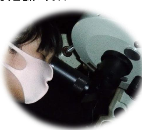
〔星と月が輝く夜空を見上げることができました〕