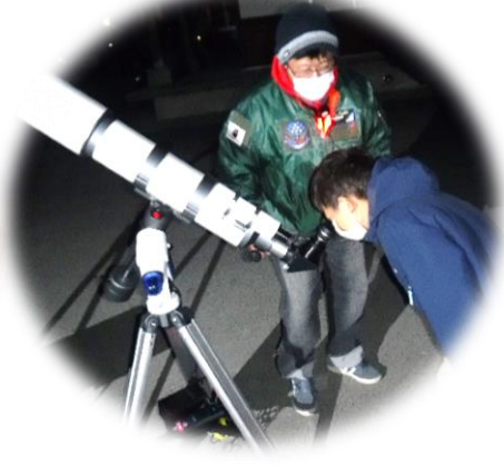
〔どんな惑星が見えるかな〕