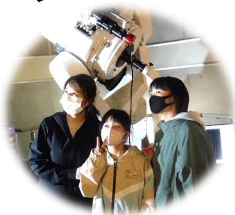
〔天文台の中には大きな望遠鏡があるよ〕