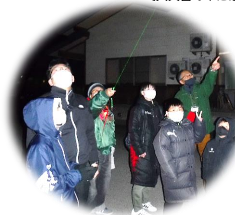
〔冬の三大角がきれいに輝いています〕