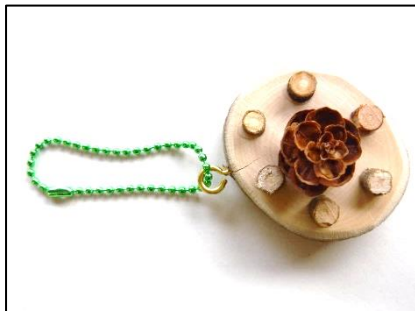
ネイチャーキーホルダー（90円）