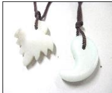
ストーンペンダント（200円）