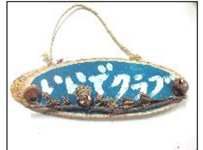
壁掛けプレート（230円）