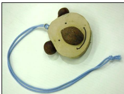
ネイチャーペンダント（90円）