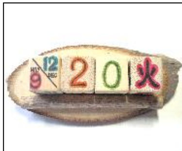
キューブカレンダー（270円）