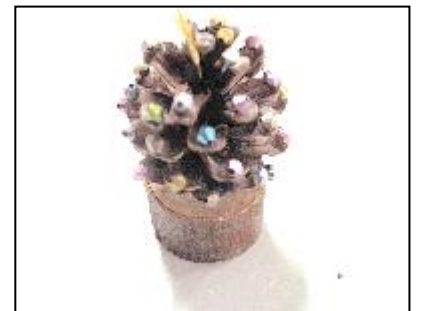
まつぼっくりツリー（90円）