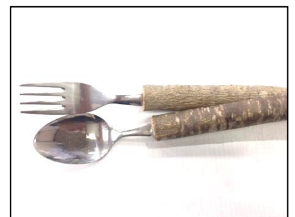
マイスプーン・フォーク（各150円）

※その他、ご要望に応じて可能なものは対応いたします。電話にて研修担当にご相談ください。