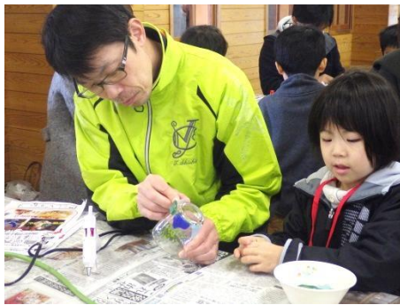
クラフト作りに挑戦！