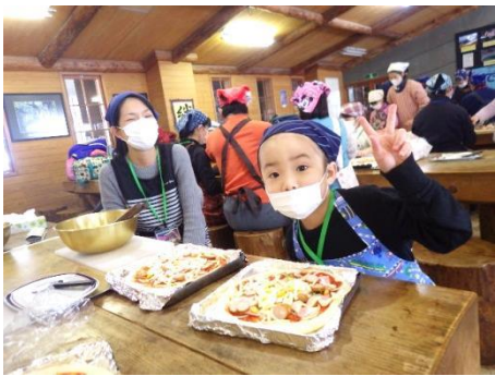
生地からピザを作るよ

「子ども達を自然の中で思いっきり遊ばせたい」、「親子でふれ合う機会を増やしたい」、「小さな子どもを持つ親同士で交流を図りたい」といった様々な願いにお応えできるように、自然の家のスタッフ一同、お手伝いさせていただきます。