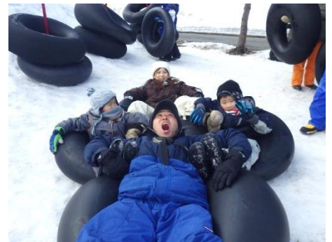
みんな大好き！チューブすべり