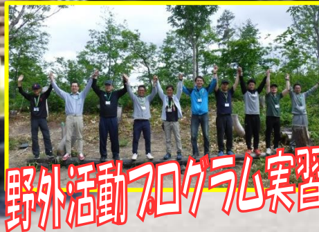
野外活動プログラム実習