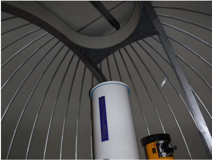
天体を自動で導入・追尾してくれる優れモノ