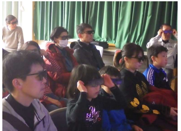
3Dメガネをかけた人には立体に見えているのです