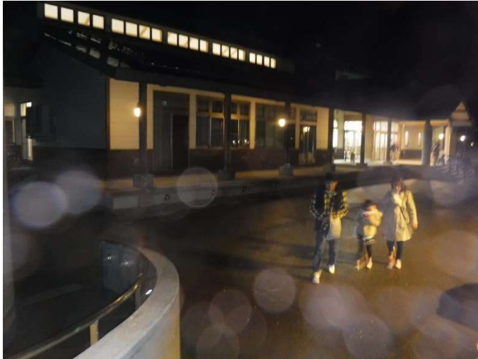
あいにくの天気となってしまいました・・・