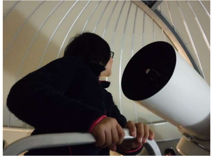
筒の中には・・・なにがありますか？