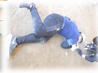
火起こし（気合ってます）