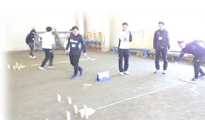
室内レクリエーション

本所利用団体の指導者を対象とする活用セミナー(第1回 4月19日、第2回 5月10日)を開催いたしました。参加者の皆様には、施設見学、野外炊飯や野外活動等に主体的・協働的に取り組んでいただきました。2回とも学校の先生方が中心で、本セミナーの意義をご理解いただけたかと思えます。年度当初のお忙しい中ご参加いただいたことに感謝申し上げます。