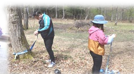
アドベンチャー遊具設置