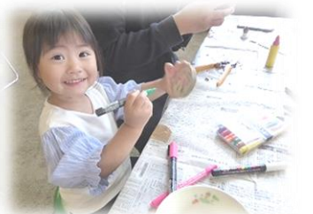
上手につくったよ