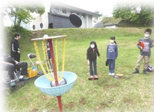
フライングディスク