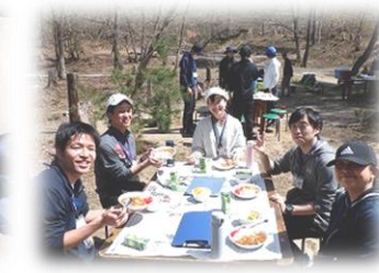
みんなでいただきます

本所利用団体の指導者を対象とする活用セミナー(第1回 4月19日、第2回 5月10日)を開催いたしました。参加者の皆様には、施設見学、野外炊飯や野外活動等に主体的・協働的に取り組んでいただきました。2回とも学校の先生方が中心で、本セミナーの意義をご理解いただけたかと思えます。年度当初のお忙しい中ご参加いただいたことに感謝申し上げます。