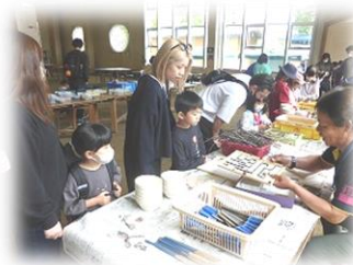
様々なクラフトづくり