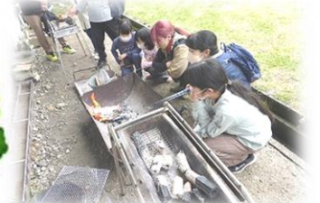
炭火で焼きマシュマロ

美しい新緑の中、飯豊少年自然の家の体験活動・交流活動がスタートしました。5月14日（日）には、「春のオープンデー」を開催しました。置賜一円から約120名の皆様にご参加いただきました。「クラフト」「アドベンチャー」の他、2年ぶりの「フードコーナー」を含め、全部で25のコーナーを設けました。1日中笑顔と明るい声が自然の中に響きわたっていたことから、多くの方に楽しんでいただけたことと思います。また、本所ホームリーダーに加え、南陽高校、他高校生ボランティアの皆様にもご協力いただき、オープンデーを盛り上げていただきました。ありがとうございました。