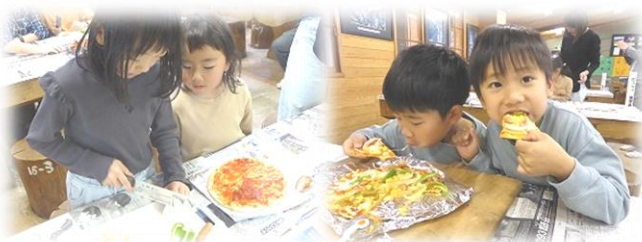
ー斗缶ピザづくり おいしいー

秋にも、同じような親子ふれあい行事として10月1日に「自然楽校でお祭りだ！」を予定しております。多くの皆様のお越しを楽しみにお待ちしております。