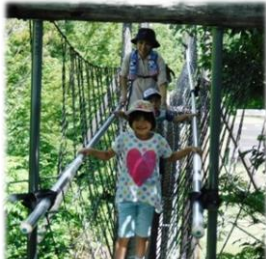
<家族で連絡橋わたり>