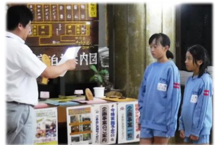
<延利用 90 万人達成!>

なお、6月12日、南陽市立宮内小学校5年生の皆さんの入所により、開所以来の延利用人数が90万人を達成しました。上記写真のとおり認定式もさせていただきました。あらためて、ご利用いただきました皆様方に感謝を申し上げます。今後ともどうぞよろしくお願いいたします。