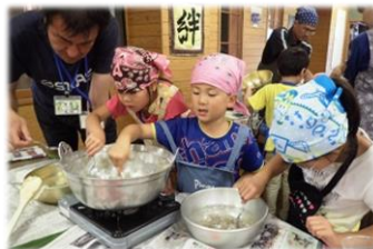
<練って、丸めて…わらび餅作り>