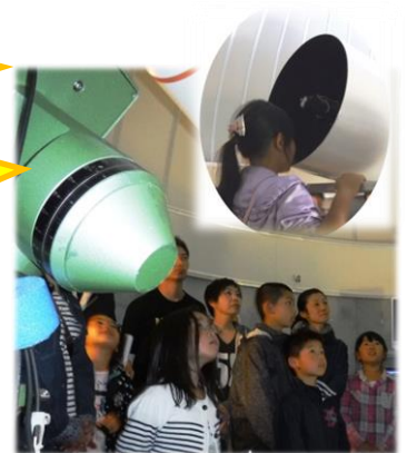
<天体望遠鏡を逆からのぞくと…>

来年度に向けて、開催時期については吟味をさせていただきます。またの開催をよろしくお願いいたします。