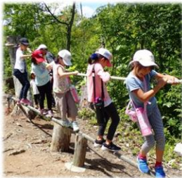
<力を合わせロープわたり>