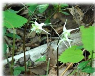
【⑤キバナイカリソウ】