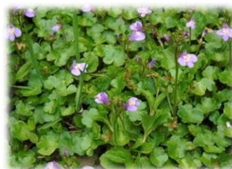
【⑧ムラサキサギゴケ】