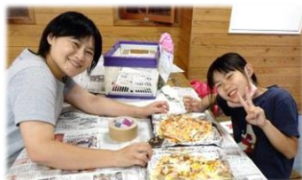
〈段ボール製のピザ窯を使っでのピザ完成!〉