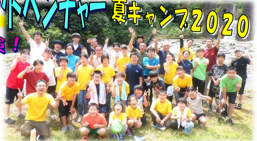
〈飯豊町中津川 岳谷親水公園での川遊びのあとの1枚〉

今年は、参加した23名全員がすべてのプログラムをやり遂げました。全員が無事に大きな達成感を持って全日程を終了できたことは何よりの喜びです。参加いただいた皆さん、ご協力いただいたホームリーダー(ボランティアスタッフ)の皆様、そして様々なご協力とご支援をいただいた関係者の皆様、本当にありがとうございました。心より感謝申し上げます。