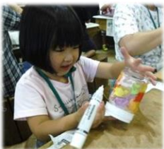
〈ランプシェード作り〉

我々職員も心が温くなるようなすてきな2日間となりました。家族での時間をじっくりと過ごしていただくことができたことをうれしく思っています。