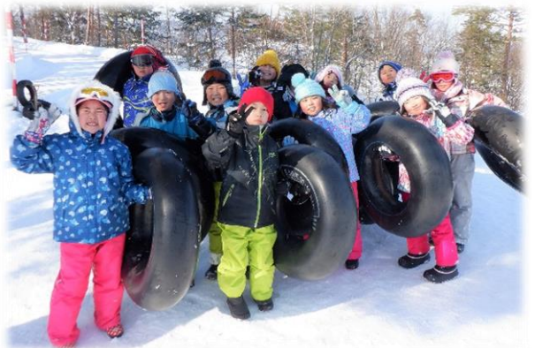
<南陽市立中川小学校1・2年生の皆さん>

今シーズンのすべり初めを予定していた“あらうんどキャンプ冬“(1/9日(金)~11日(月)、会津・山形「体験の風をおこそう」運動実行委員会事業)が、新型コロナウイルス感染症の影響等で中止になってしまったため、1/16(土)の“第4回自然大好き! いいでクラブ”からスノーチューブすべりを楽しんでいただいております。悪天候の日もありましたが、ほぼ毎日、午前と午後