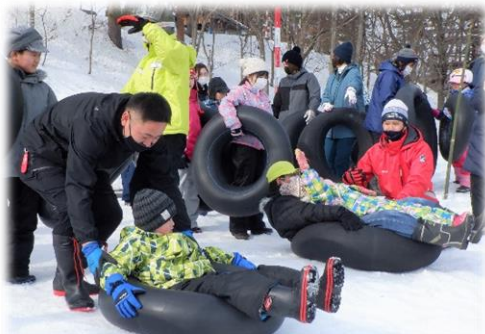
<しゃぼん玉クラブ窪田の皆さん>

わくわくスノーランドのご利用は、2月の末まで続きます。コロナ対策も含めて、安心、安全に、スノーチューブすべりを楽しんでいただけるよう、ゲレンデの整備に努めてまいります。いいでスノーランドで多くの方々が“おもいっきり体験”を味わっていただけるよう願っております。