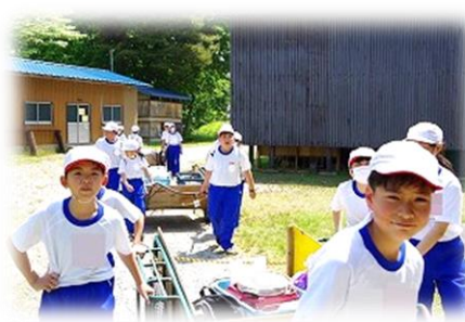
5年生の宿泊学習みんなで協力!