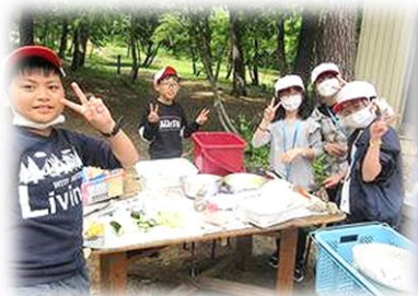
野外炊飯でカレー作り!