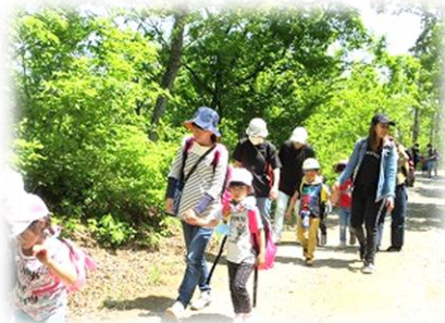
親子で自然の散策(親子行事)