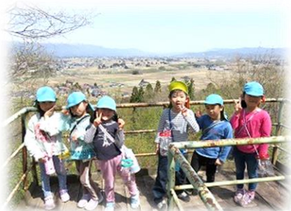
幼稚園の子ども達 展望台でパチリ