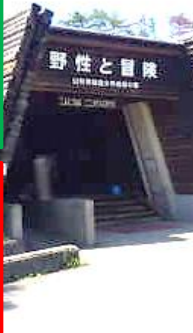
施設・館内設備案内