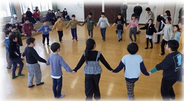
アイスブレイクでみんな打ち解け合いました。