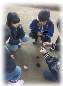
火起こしでは全ての班で火がつかしました。