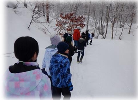
キャンプ場まで早朝ハイキング