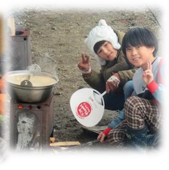
おいしいカレーもできました。

3月8日・9日と3・4年生のためのプレキャンプを行いました。20名の参加で、様々な活動をみんなで協力して行いました。1泊2日で、みんなひと回り成長していきました。