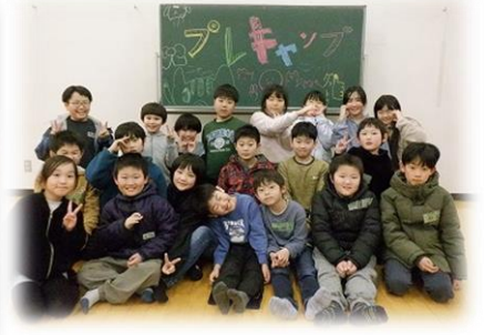
たくさんの新しい友達をつくることができました。