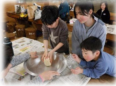
一斗缶ピザもおいしく焼けました。